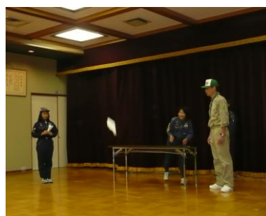
飛行機飛ばしゲーム