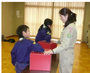
ブラックボックスゲーム