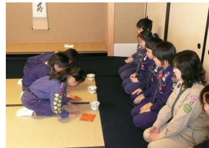
お運びも上手く出来ました