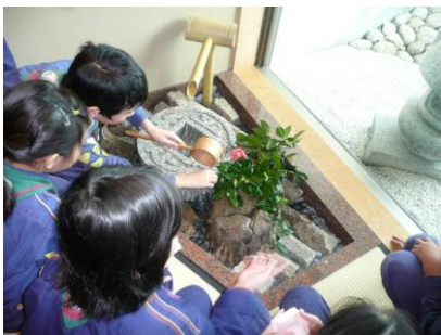
蹲(つくばい)で手と口を清めます