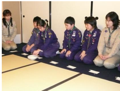
お菓子をちょうだいします