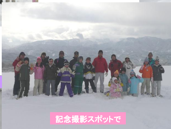
記念撮影スポットで