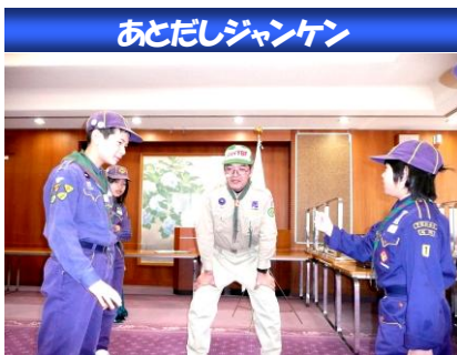
あとだしジャンケン