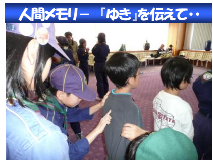
人間メモリー「ゆき」を伝えて...