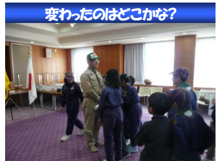
変わったのはどこかな?