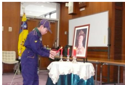
赤いろう/くまに灯を灯します