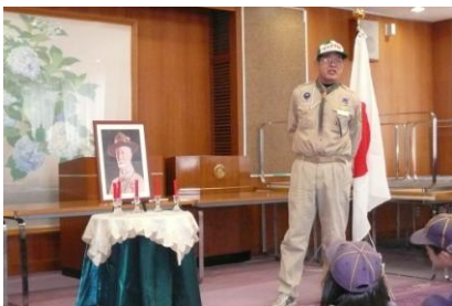
隊長からBP祭のお話

ベーデンパウエルの肖像に、しかスカウトたちが献灯・くまスカウトたちが献花をしました