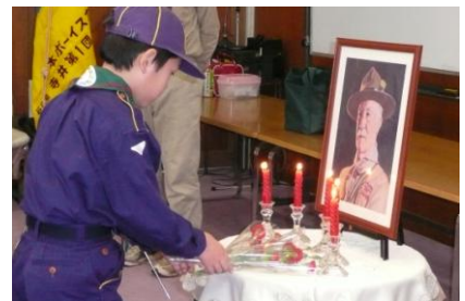
赤いカーネーションを捧げました