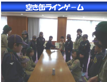
空き缶ラインゲーム